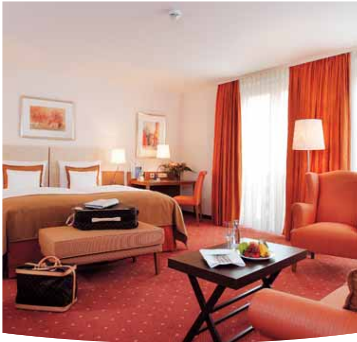
Gästezimmer / Guest room