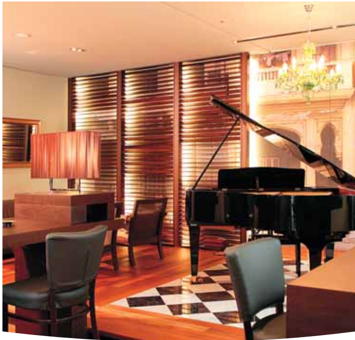
Bar & Brasserie NitriBizz