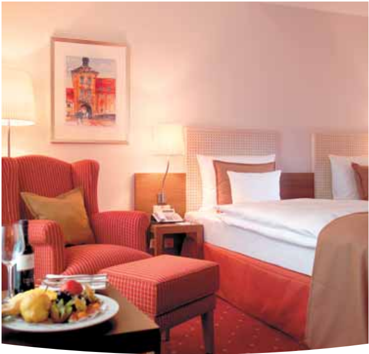
Gästezimmer / Guest room