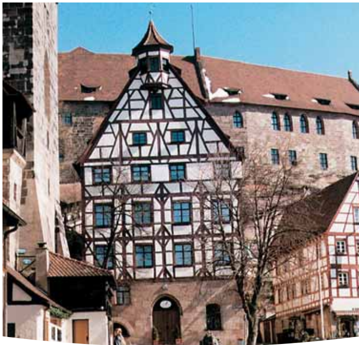
Nürnberg Platz am „Tiergärtnertor“