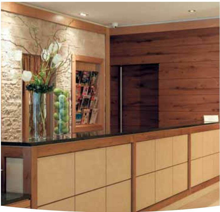
Rezeption / Reception