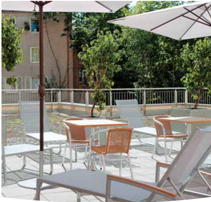
Sonnterrasse vor der Sauna / Sun-deck