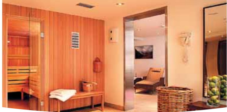
Fitness & Sauna