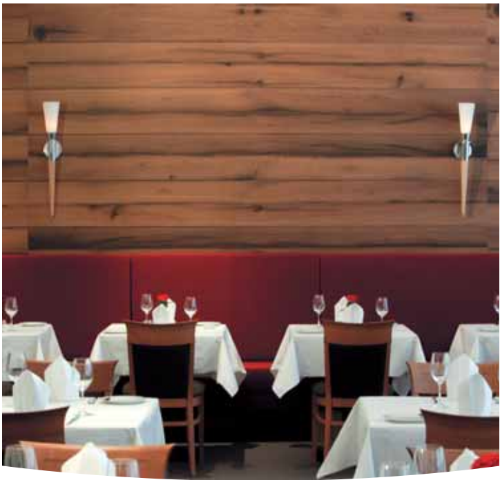
Restaurant St. Jakob